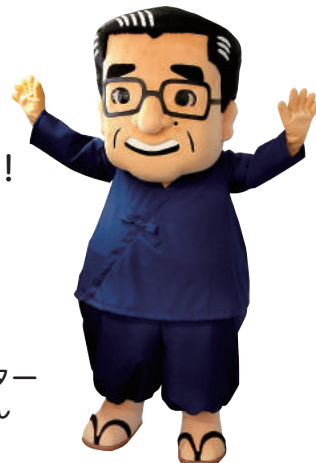
木口福祉財団キャラクター まもりん

● 駐車場はございますが、混雑が予想されますので公共交通機関の利用をお願いします。