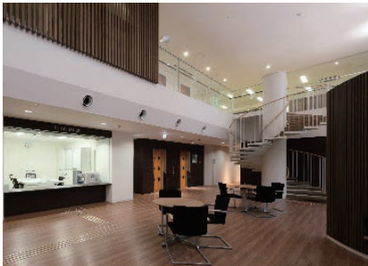
木口記念会館 ロビー

木口福祉財団は、市民参画型福祉の促進と振興をはかり、障がい者など社会的に弱い立場におかれている方々にやさしく、明るく住みやすい地域社会の創造に資することを目的に、ボランティア活動や福祉活動などのお手伝いをしています。