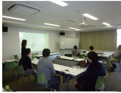
事業所による 障害者就労支援サロン