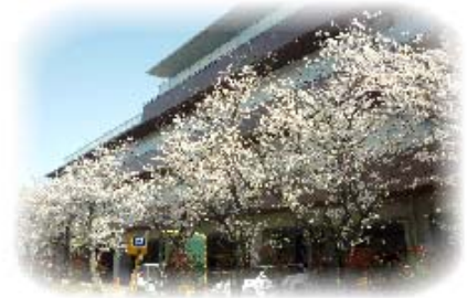
(今年咲いた 会館の桜)